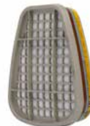
6057 Gas- en dampfilter

Kan gebruikt worden met alle half- en volgelaatsmaskers en met en zonder deeltjesfilters