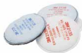
2000 Serie Stoffilters

Deze filters bieden weerstand tegen schuren en bevochtiging.