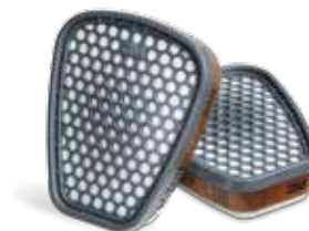
6051i Gas- en dampfilter

Kan gebruikers helpen om te bepalen wanneer ze hun filters in een gepaste omgeving* kunnen vervangen of om een bestaand filtervervangingschema aan te vullen.